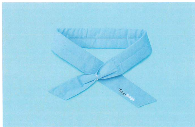
しろくまのきもち ネッククーラー